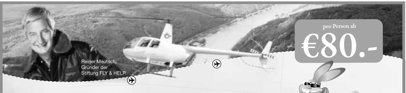
Reiner Meutsch, Gründer der Stiftung FLY & HELP