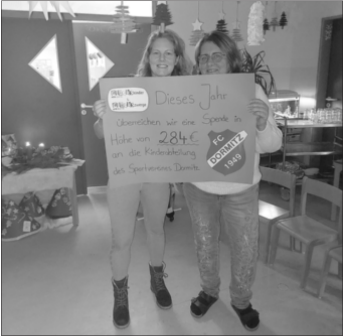
Das Ergebnis kann sich mit einem Erlös von 284 Euro sehen lassen. Glückskinder und Glückszwerge KiTa Dormitz