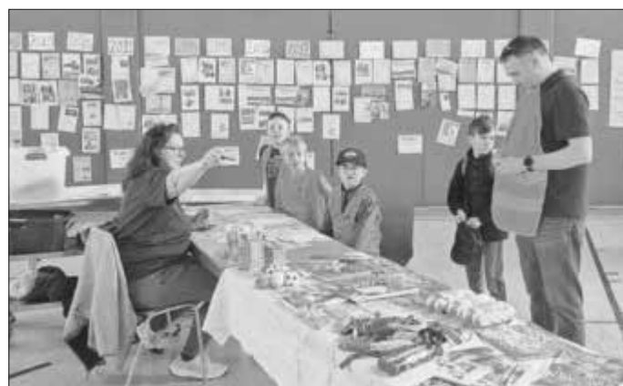
Ausgabe der Teilnahmeurkunden

Diese vom Umweltministerium unterstützte Kampagne soll den Blick für die Belange des Naturschutzes öffnen und das Umweltbewusstsein stärken, was sich auch mit der Idee der lokalen Agenda21 deckt.