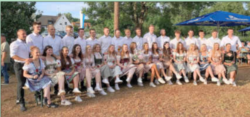
Die Steinbacher freuen sich auf die Kerwa und ihre Gäste

Für Unterhaltung, Speis' und Trank wird stets bestens gesorgt sein!