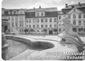
Eichstätt Marktplatz

Dollnstein liegt in einem weiten Talkessel, den in erdgeschichtlicher Zeit Urdonau und Altmühl an ihrem Zusammenfluss schufen. Er ist der geeignete Ausgangspunkt für Wanderer, Kletterer, Rad- und Bootfahrer. TreffpunktDeutschland.de/dollnstein