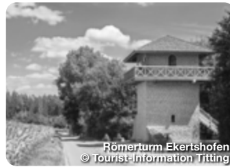
Römerturm Ekertshofen

Hier überraschen mehr als 70 Nachbildungen der Urzeitgiganten in Lebensgröße. Beim Fossilenschlagen in der Mitmachhalle gehen alle mit Hammer und Meißel auf die Suche nach echten Versteinerungen. Dinopark 1, Denkendorf