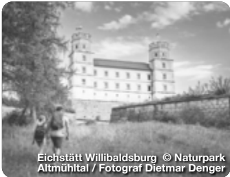
Eichstätt Willibaldsburg

TreffpunktDeutschland.de/eichstaett-region