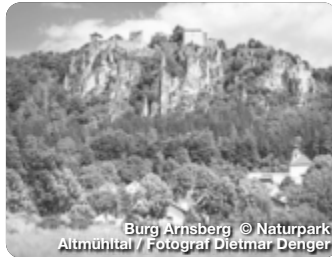
Burg Arnsberg