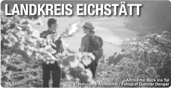
Altmühltal Blick ins Tal

Alle Termine und Angaben unter Vorbehalt!