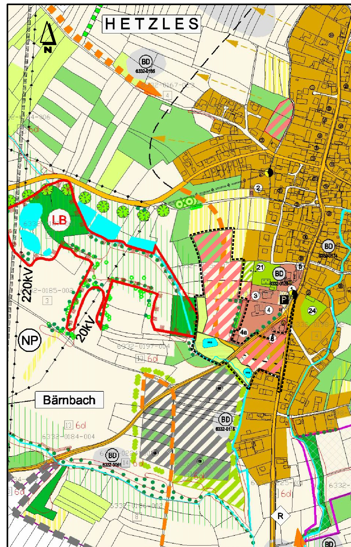
Geplante 1. Änderung des Flächennutzungsplanes