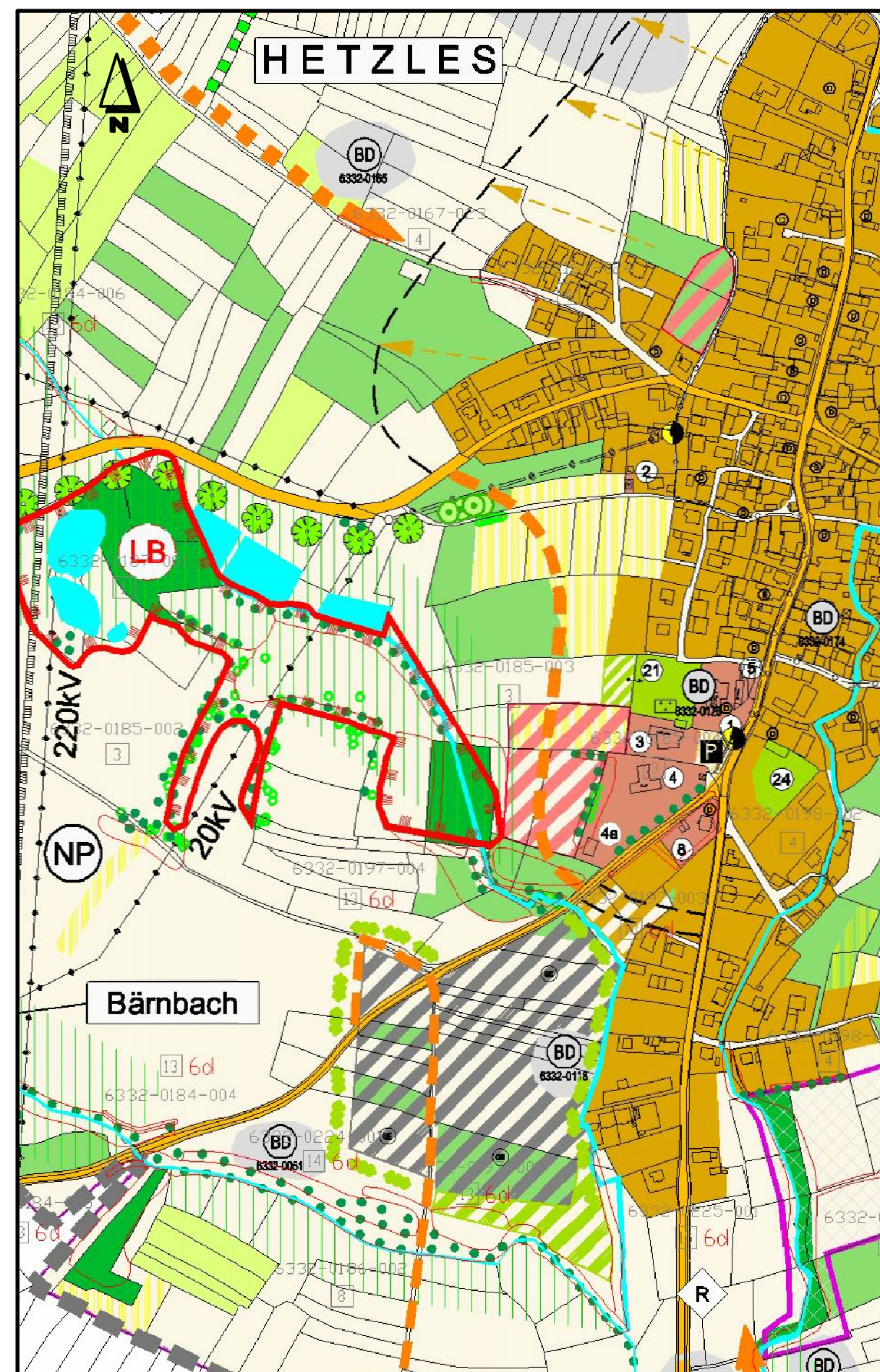
Aktueller Flächennutzungsplan Stand 12.02.2008