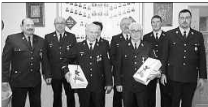
Neu gewählte und ausgeschiedene Vorstandschaftsmitglieder